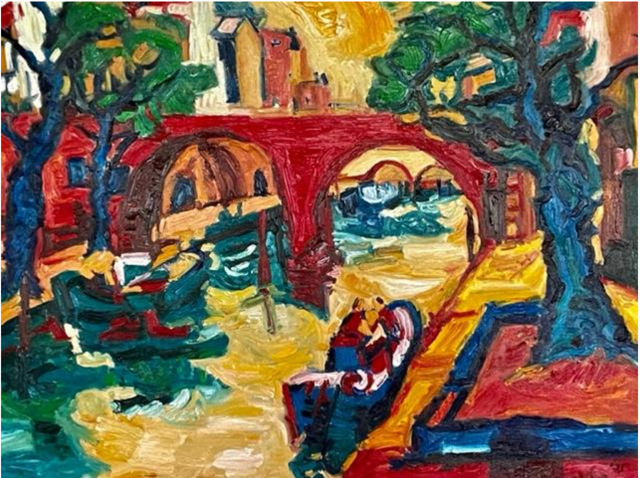
“Oude Gracht Utrecht” van Tibo van de Zand, aangekocht in 2022 door Huize Het Oosten, mede mogelijk gemaakt door een bijdrage van bewonersvereniging De Huiskring.